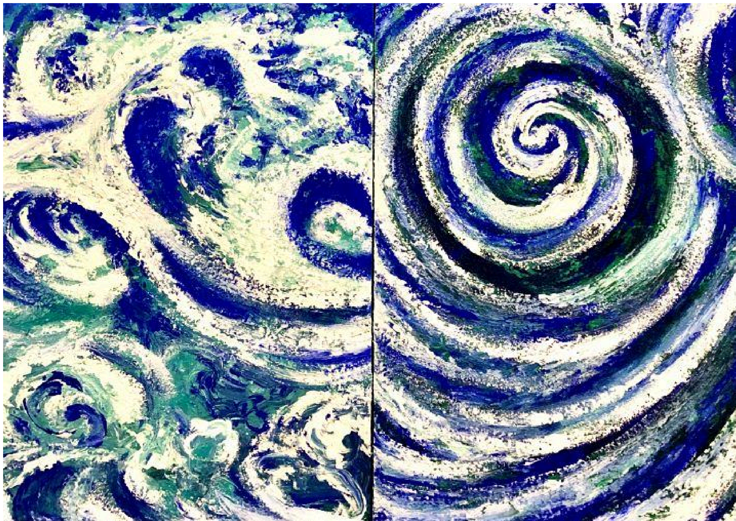
A Grande Onda em Nazaré | Acrílico e areia do mar sobre tela