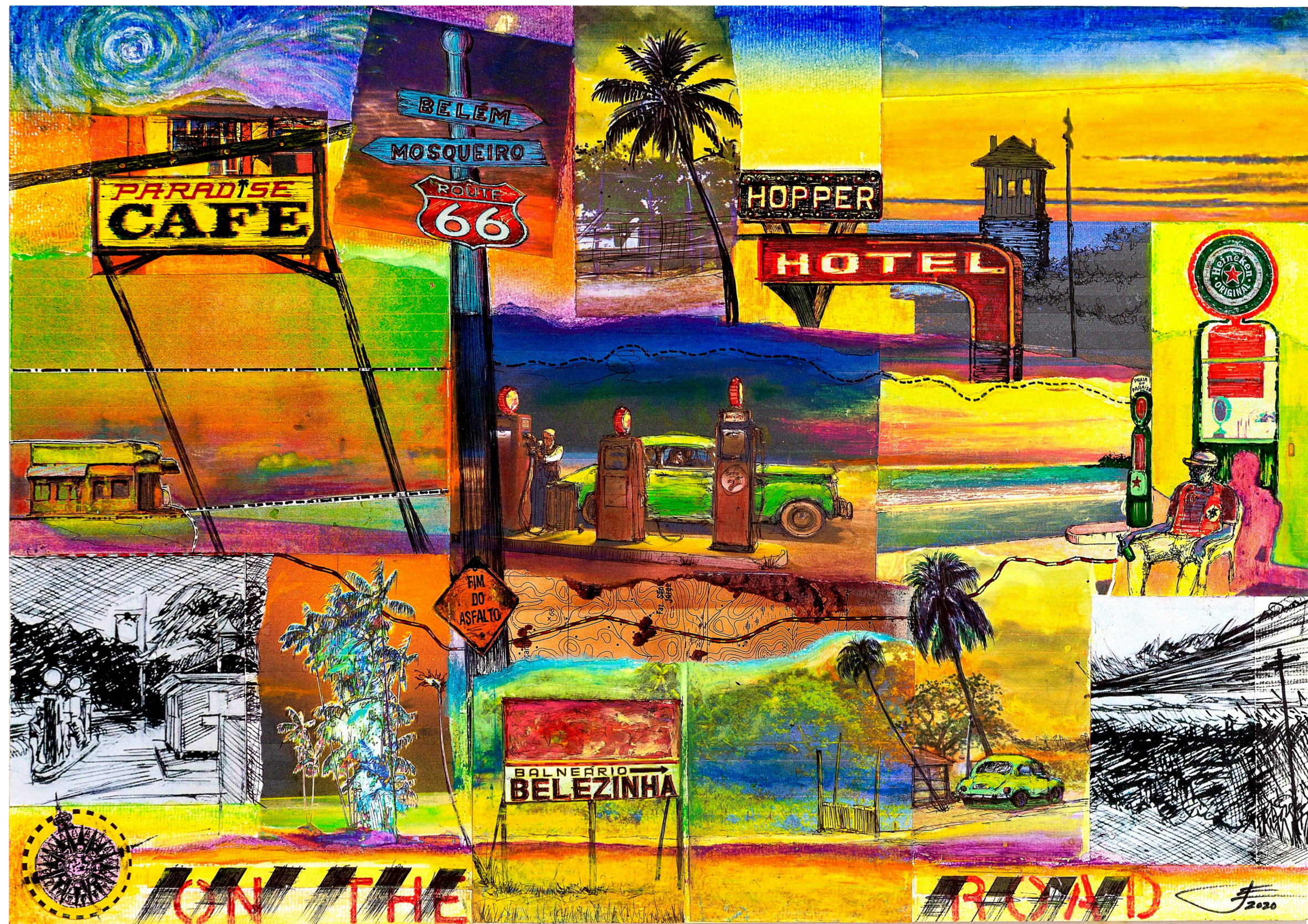
On the Road | mista sobre papel