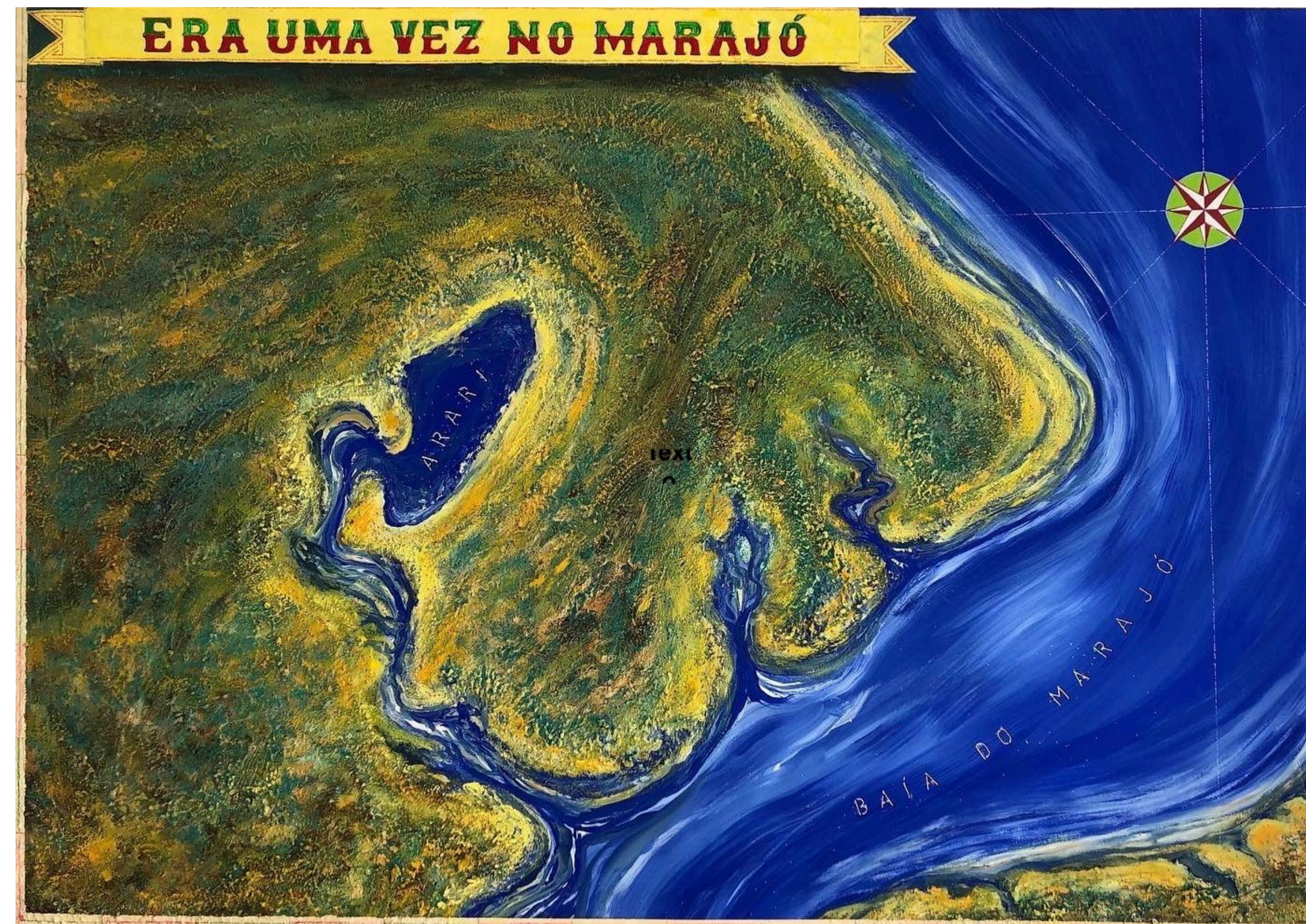
Azulejaria Ultramarina | Acrílico sobre tela