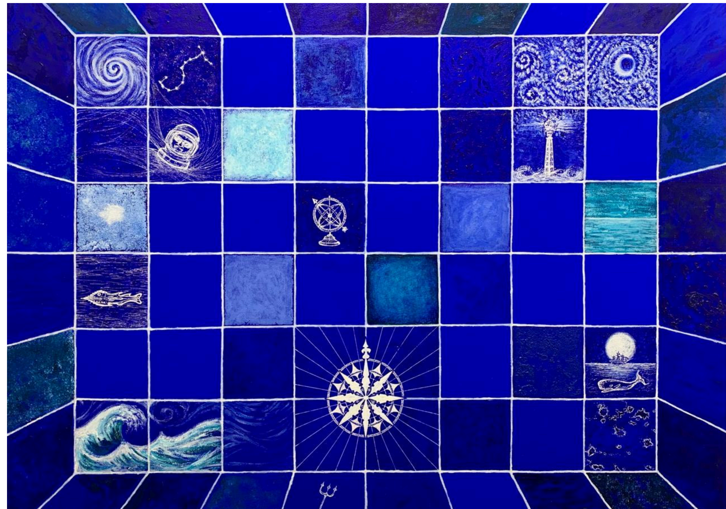
Azulejaria Ultramarina | Acrílica sobre tela